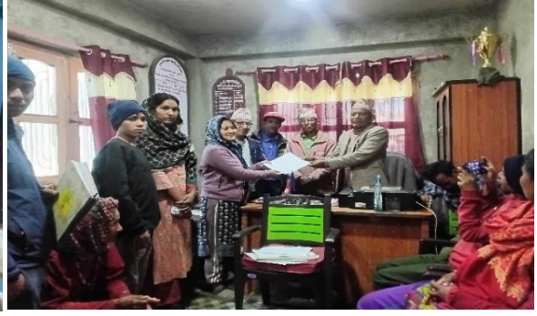
फोटो बाल भेलाबाट आएका सवाल वडा अध्यक्ष ज्यूसँग पेस गर्दै ।