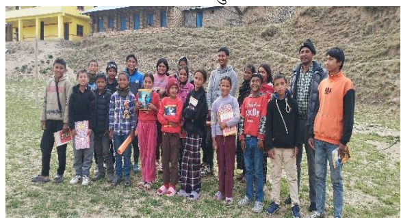
फोटो दुर्गा बाल क्लव