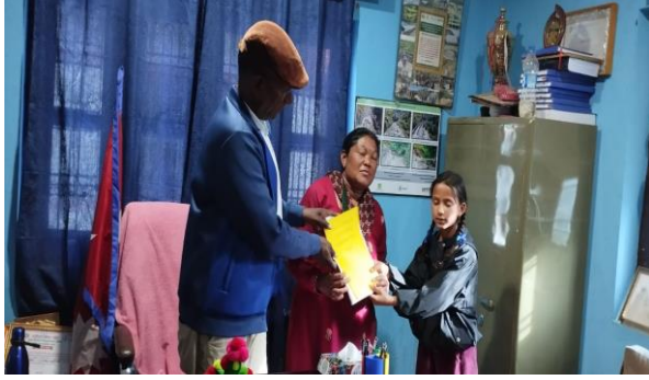
फोटो बाल भेलाबाट आएका सवाल पालिका अध्यक्षज्यूसँग पेस गर्दै ।