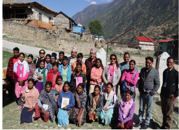
फोटो बाल क्लबका पदाधिकारी संग सेभ द चिल्डेन नेपाल प्रमुख