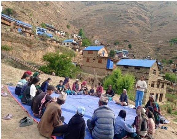
फोटो बाल क्लबका पदाधिकारीसँग छलफल