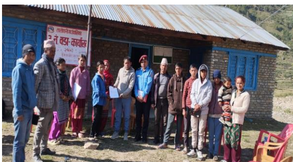
फोटो बाल भेलाका सवाल वडा कार्यालयलाई पेस गर्दै