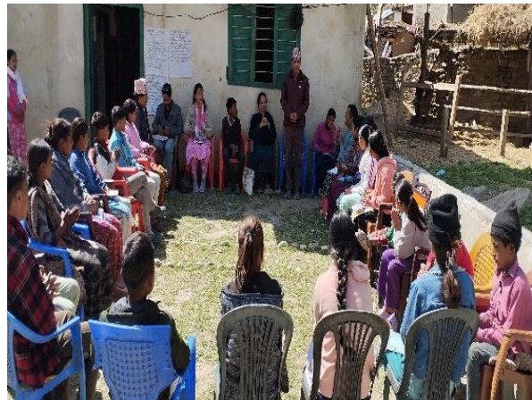
फोटो बाल क्लबका पदाधिकारीसँग सेभ द चिल्डेन नेपाल प्रमुख