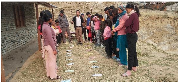
फोटो बाल भेला