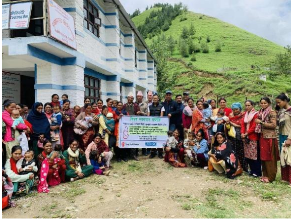
फोटो आयोडिन सप्ताह कार्यक्रम