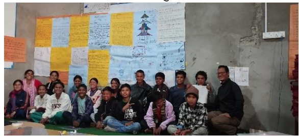
फोटो बाल पत्रकार तालिम