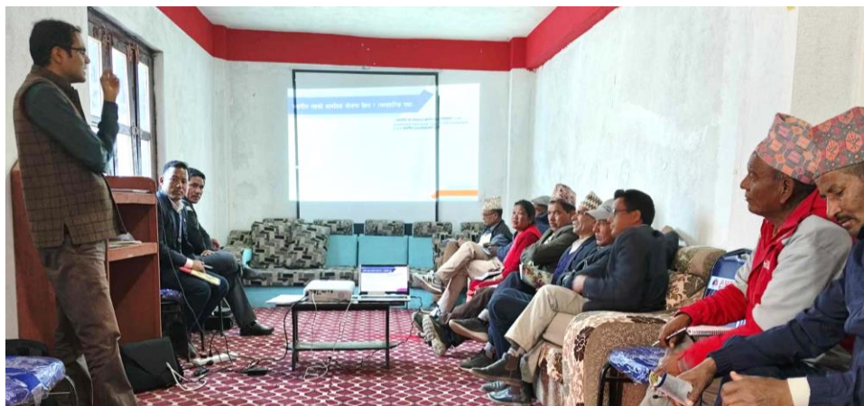
फोटो १ : मध्यकालीन खर्च संरचना तर्जुमा अभिमुखीकरण कार्यक्रममा उपस्थित तातोपानी गाउँपालिकाका सरोकारवालाहरु